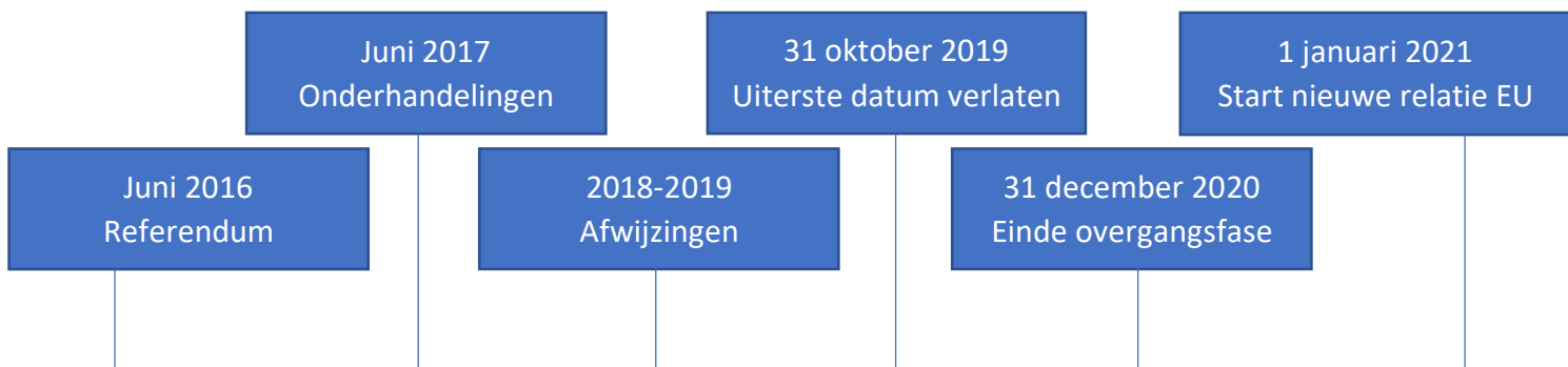
Figuur 1: Tijdslijn Brexit

Als de uitkomst van de EU-top een 'zachte' Brexit is, geeft dat een lange tijd onzekerheid: over nieuwe regels, wanneer ze ingaan, hoe ze moeten worden geïnterpreteerd, waar je iets moet regelen en wat er in de overgangperiode geldt. Dit proces kan nog wel 10 jaar duren.