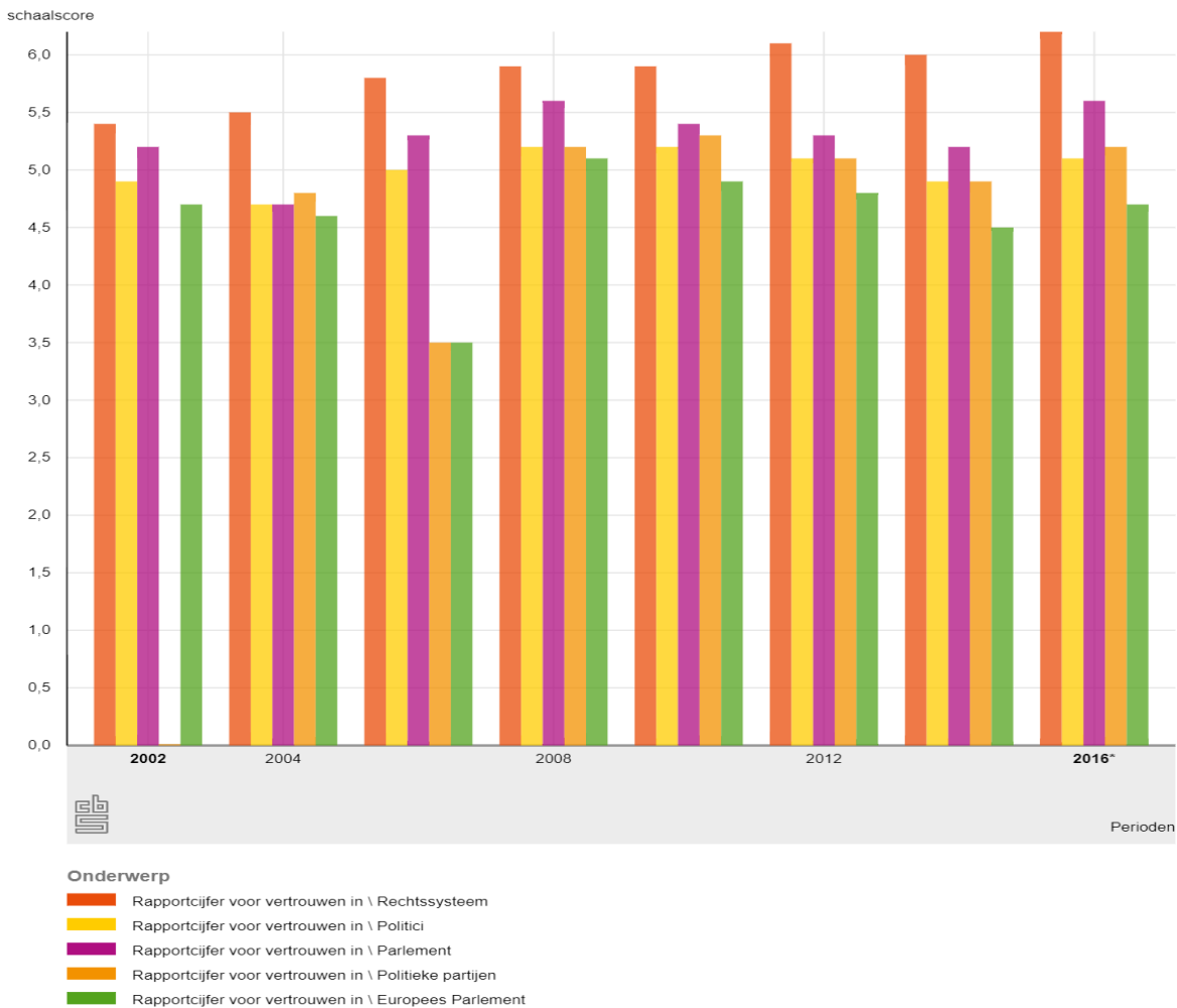
Figuur 1 Vertrouwen in mensen, recht en politiek in Nederland